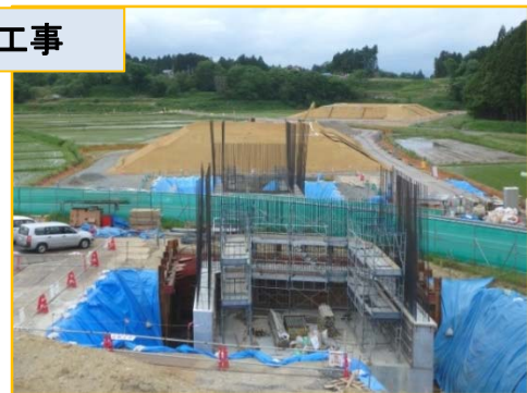
写真-2 橋台の施工状況(登米側)